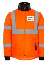
Poitrine côté cœur

Dimensions maximales : 80 x 50 mm | 60 x 60 mm