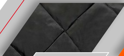
Doublure fixe matelassée